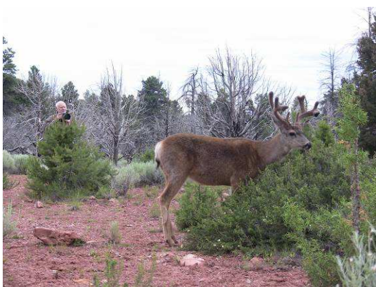
Bernard se passionne pour la photo, son appareil ne le quitte plus, ici aux Etats Unis en été 2009